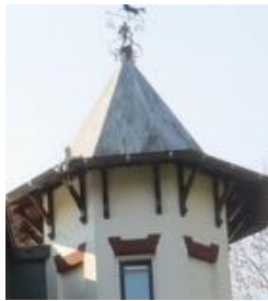
Torentje van Koningin Emmalaan 17a

Aan de hand van afbeeldingen van torens en torentjes schetst Klaas Oosterom, van de Historische Kring Bussum, de ontwikkeling van Bussum. Torens uit de periode rond 1900 staan symbool voor de sterke groei van Bussum als forensenplaats nadat er een treinen tramstation was gekomen. Maar ook tonen zij de welstand